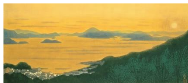
《燦・瀬戸内(輝く瀬戸内海)》1997年

休館日 会期中無休 開館時間 10:00-17:00 (入館は16:30まで) 入館料 一般1200円/高大生800円/小中学生無料 *障がい者手帳をお持ちの方無料、介護者の方1名まで600円 *70歳以上の方、20名以上の団体 各100円割引