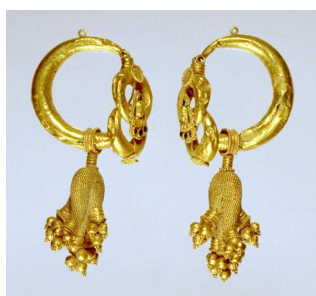
耳飾り 2-3世紀 金