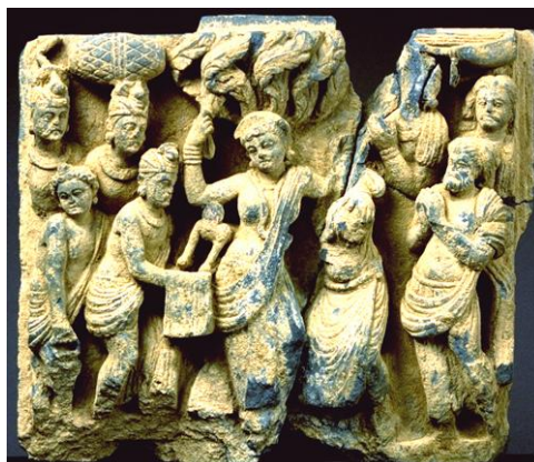
仏伝図 誕生 2-3世紀 片岩