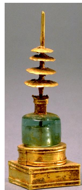
舎利容器 2-3世紀 金・水晶