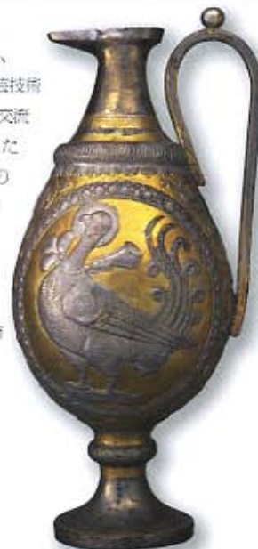
鍍金銀製水差 ウズベキスタン南部? 700年頃