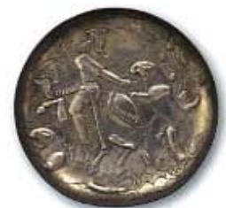
帝王狩獵文銀 アフガニスタンまたはトルクメニスタン 3-4世紀 銀・鍍金