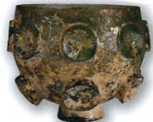
浮出切り鉢 イラン 6-7世紀 ガラス