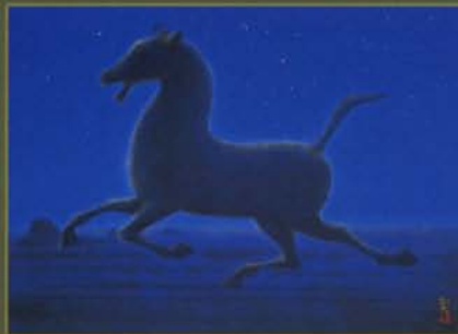
西域の馬 平山郁夫 1978年