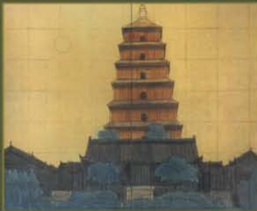
薬師寺玄奘三蔵院 大唐西域壁画 「明けゆく長安大雁塔」(大下図)

20世紀最後の日である平成12年(2000年)12月31日大晦日、平山郁夫は奈良薬師寺の玄奘三蔵院で30年の歳月をかけた「大唐西域壁画」に最後の一笔を入れ完成させました。今期は構想を固める最初期の段階で手がける小下図と、最終的な原寸大設計図ともいべき大下図を、七場面一挙に公開します。壮大なスケールで展開する完成までの工程、本画では塗り込められてしまっ見えなような生々しい描線をご覧いただける貴重な機会となります。また、汗血馬を鬃鬣とさせる馬を幻想的に描いた「西域の馬」(1978年)を特別公開します。