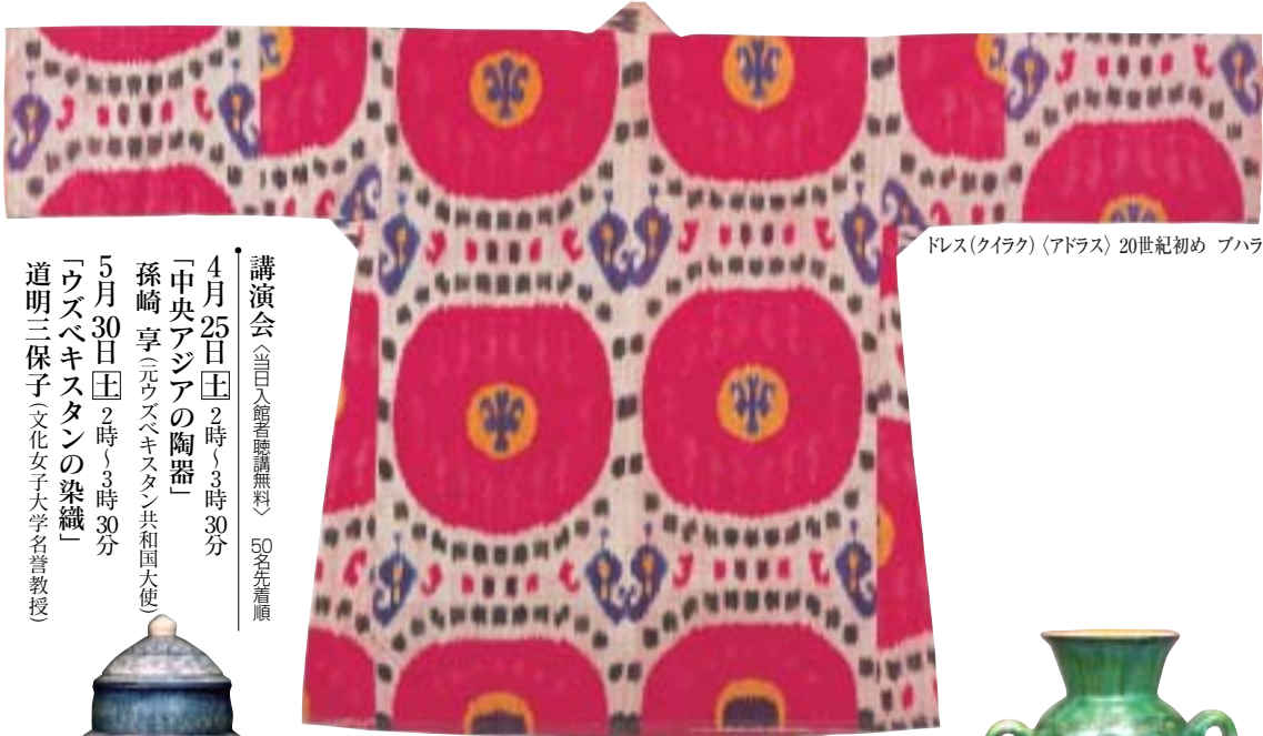
ドレス(タイラク)〈アドラス〉20世紀初め プハラ