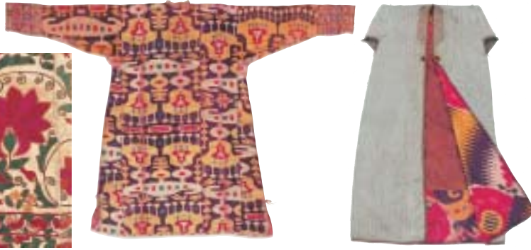
コート(ムルサク) 19世紀末 ベルベット 絹

スザニは現在のウズベキスタンを中心に作られた婚礼用刺繍布で、赤い円文や花蔓草文を特徴とし、壁掛けやベッドカバーに用いた。