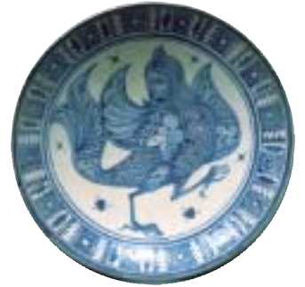
皿 20世紀 タシュケント

イスラーム陶器の伝統を受け継いだ現代の匠たちが作り出す陶器は、地域と民族の嗜好を反映して色彩に独自性を見せている。