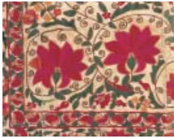
掛布（スザニ）部分 20世紀初め 絹・綿

スザニは現在のウズベキスタンを中心に作られた婚礼用刺繍布で、赤い円文や花蔓草文を特徴とし、壁掛けやベッドカバーに用いた。