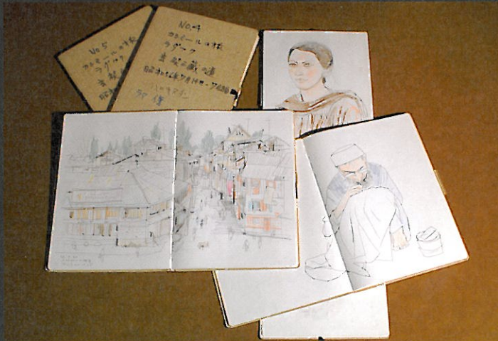
平山郁夫のスケッチブック