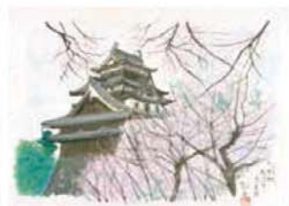
松江城 松江市 1996年