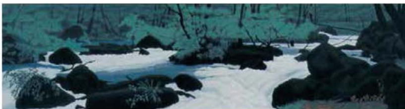
流水間断無(奥入瀬溪流) (部分) 1994年