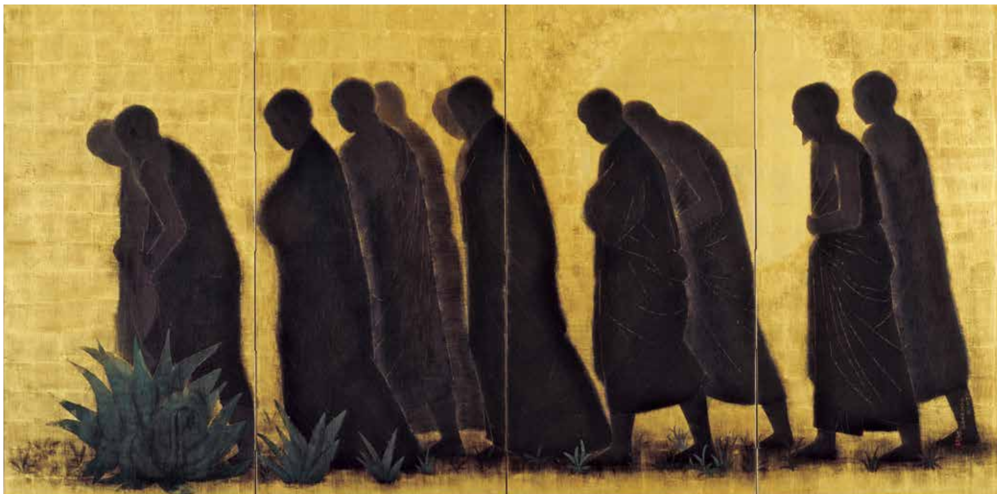
平山郁夫 《求法高僧東歸図》 1964年 平山郁夫美術館蔵

平山郁夫シルクロード美術館 HIRAYAMA IKUO SILK ROAD MUSEUM