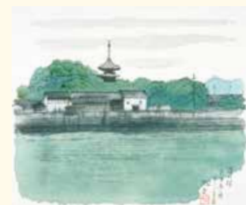
《讃岐路 志度寺の塔 四国八十六番霊場》 1992年 朝日生命保険相互会社蔵 *当館初公開