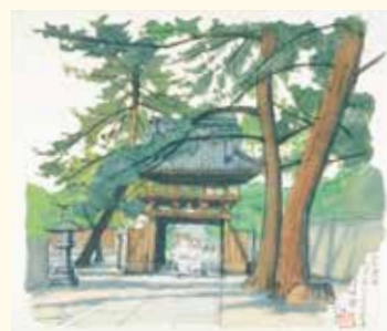
《善通寺 四国第七十五番霊場 讃岐路》 1992年 朝日生命保険相互会社蔵 *当館初公開