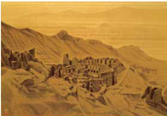
《ガンダーラの遺跡》 1983年