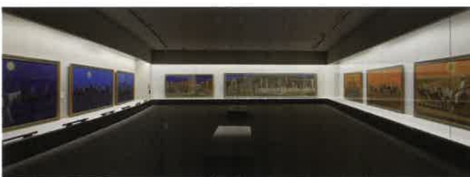
2階展示室6 シルクロードを旅するキャラバンを描いた平山郁夫晩年の傑作「大シルクロードシリーズ」