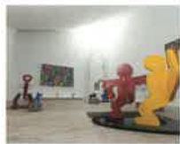
All Keith Haring Artwork ©Keith Haring Foundation