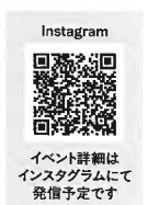
Instagram イベント詳細は Instagramにて 発信予定です

HAU Guide Pass事務局 TEL : 070-4774-2967 MAIL : hau.guide.pass@gmail.com