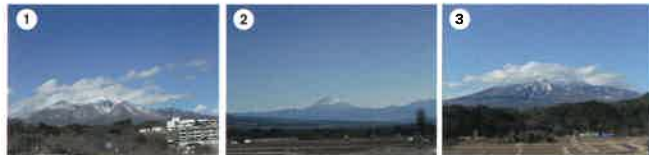
周遊ルート上でご覧頂ける富士山と八ヶ岳連峰

車窓から望む八ヶ岳山麓。 春を迎える北杜市と魅力的な アートスポットをガイドとともに巡ります。