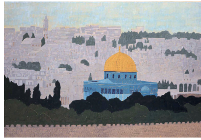
平山郁夫 画室に残されていた制作中の作品 2009年