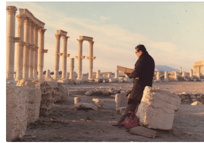
シリア・バルミラ遺跡にて 1979年

平山郁夫が生涯をかけて旅し、描き続けたシルクロードの風景や遺跡、旅先で出会った人々、砂漠を旅する隊商の行列...そこに込められた平和への願い、その壮大な絵画世界を平山夫妻が収集したシルクロードの美術品を交えてご紹介します。