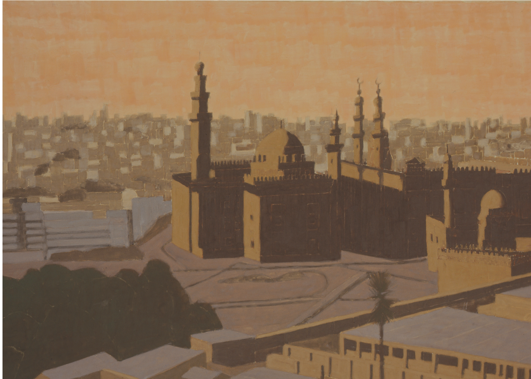
平山郁夫 画室に残されていた制作中の作品 2009年